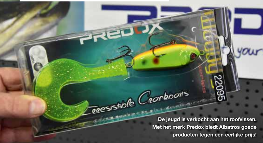
De jeugd is verkocht aan het roofvissen. Met het merk Predox biedt Albatros goede producten tegen een eerlijke prijs!

gaan vissen en genieten van deze mooie vrijetijdsbesteding en de prachtige natuur waar zich dit in afspeelt. Daarnaast alle wateren, of in ieder geval zoveel mogelijk wateren openstellen voor iedereen. Zo min mogelijk beperkingen door de regels en voorschriften duidelijk en algemeen te houden en zorgen dat vergunningen en VISpassen makkelijk en overal op ieder gewenst moment verkrijgbaar zijn. Zorg dat de visstand goed is, zodat er genoeg vis gevangen kan worden.