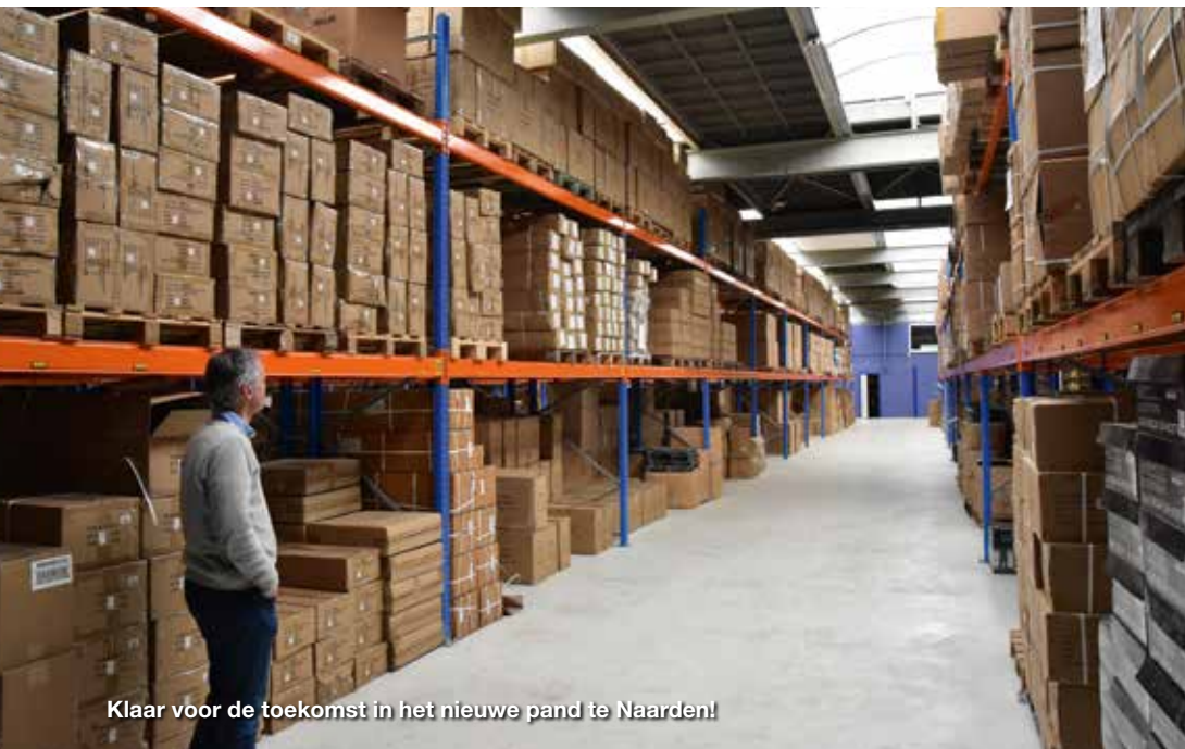
Klaar voor de toekomst in het nieuwe pand te Naarden!