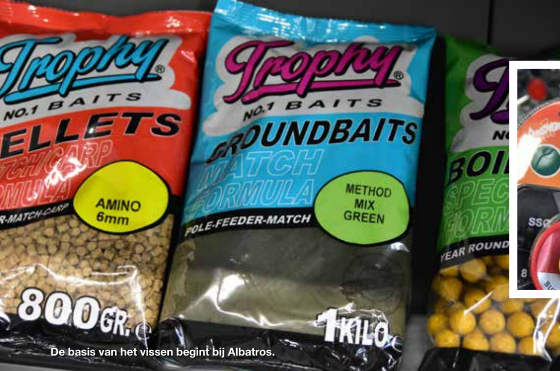
De basis van het vissen begint bij Albatros.