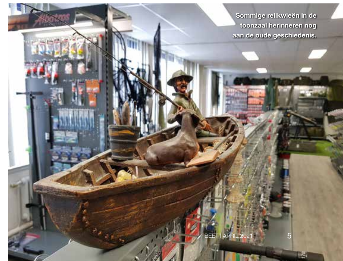
Sommige relikwieën in de toonzaal herinneren nog aan de oude geschiedenis.