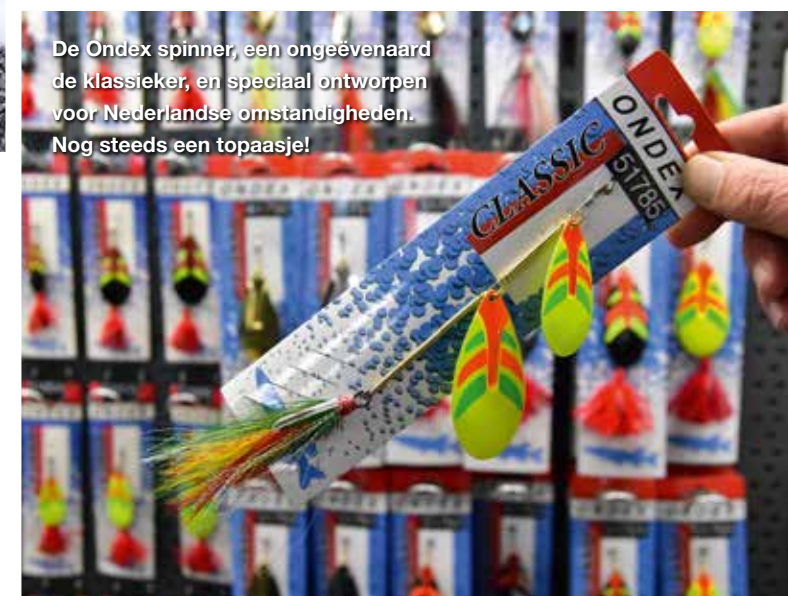
De Ondex spinner, een ongeëvenaard de klassieker, en speciaal ontworpen voor Nederlandse omstandigheden. Nog steeds een topaasje!