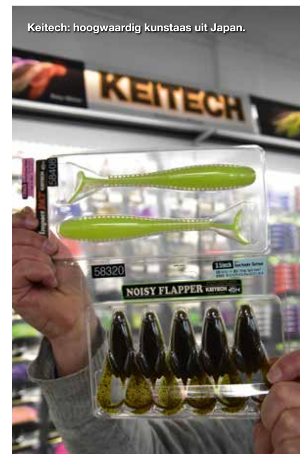
Keitech: hoogwaardig kunstaas uit Japan.

Afgelopen jaar was voor Albatros een ongekend intens jaar. Het begon met de plannen voor de verhuizing van Rijsenhout naar Naarden. Het verkoopseizoen 2019/2020 begon heel rustig. Toen kwam de COVID-19 uitbraak. Belgische en Duitse winkels gingen op slot, maar Nederland bleef open. Onze vertegenwoordigers bleven de Nederlandse winkels bezoeken echter werden we aanvankelijk de winkels uit gekeken. ‘Wat kom je doen?’ was een veel gehoorde opmerking van de winkeliers. Het weer was prachtig, ouders konden weinig ondernemen met de kinderen, want alles aangaande vertier was gesloten. Nederland ging massaal vissen en de hengelsportartikelen waren niet aan te slepen. Er zijn veel nieuwe vissers bijgekomen, maar ook herintreders die ons belden met de vraag of wij een Albatros catalogus konden opsturen, deze hadden ze vroeger op het nachtkastje liggen. Wij moesten deze herintreders teleurstellen, want wij maken al jaren geen catalogus meer voor het publiek enkel nog voor de dealers. Door de enorme verkoop ontstonden gaten in de voorraad en zijn wij snel opdrachten gaan geven